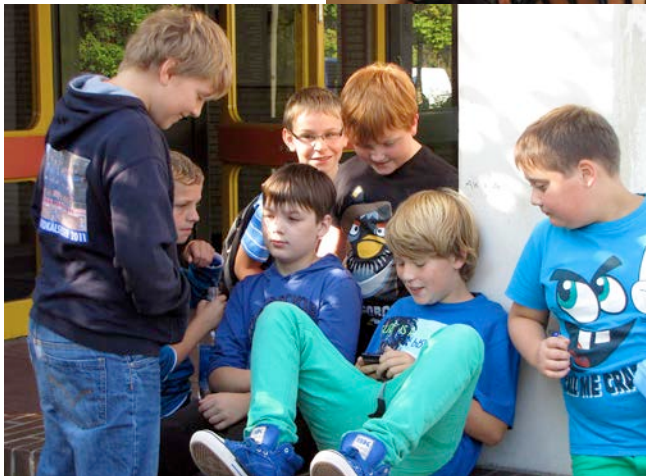
In den Pausen bietet unsere Schule reichlich Platz für Erholung, Bewegung und alles was man braucht...