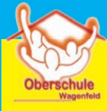
Oberschule Wagenfeld - Ganztagschule -