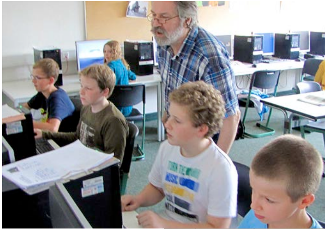
Unterricht in einem unserer Computerräume

Der Bereich Musik ist vielfältig aufgestellt: Vom einfachen Musikinstrument bis hin zum digital gesteuerten Audio- und Videoschnitt.