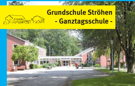
Grundschule Ströhen - Ganztagschule -