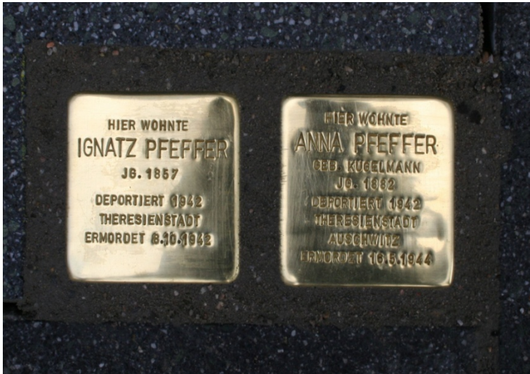
Abb. 101: Stolpersteine für das Ehepaar Pfeffer in Gießen, welche am 26. April 2008 vor dem einstigen Wohnhaus von Ignatz Pfeffer und Anna, geb. Kugelmann verlegt wurden.