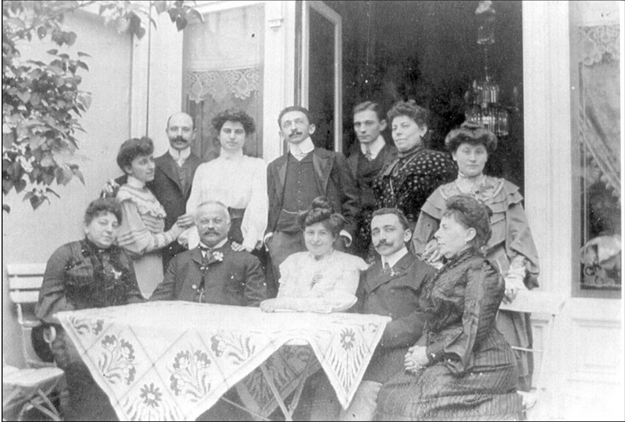
Familienbild der Familien Lehmann und Kugelmann, aufgenommen in Antwerpen um 1904.