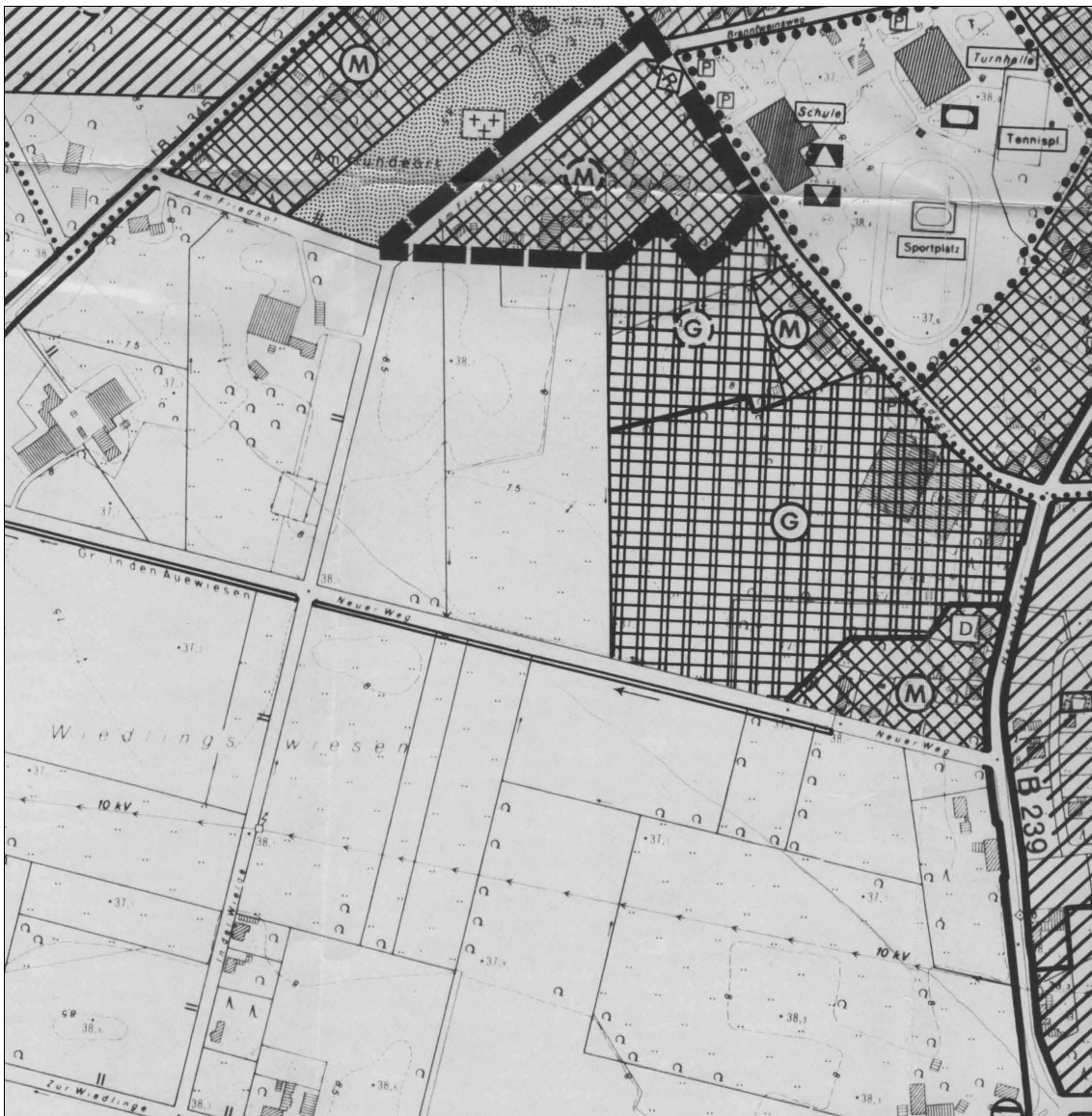
Auszug aus dem wirksamen Flächennutzungsplan

In diesem wirksamen Flächennutzungsplan ist das Plangebiet als Fläche für die Landwirtschaft dargestellt. Die Darstellung erfolgte gem. dem Flächennutzungsplanmaßstab, ohne eine weitere Differenzierung, genau wie viele andere bebaute Streusiedlungsflächen und kleine Siedlungen.